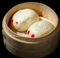
302 PANE CONIGLIO 2 pz. Ripieno con crema all'uovo €5.00