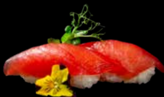
36B NIGHIRI TONNO