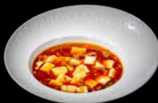
138 TOFU PICCANTE CON CARNE €6.00