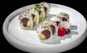
40 TONNO AVOCADO