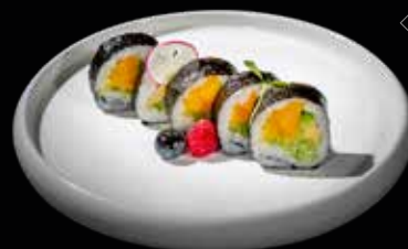
74 FUTOMAKI VEGETARIANO 5 PZ. avocado, cetriolo e mango €7.00