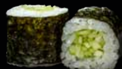
71B HOSOMAKI CETRIOLO