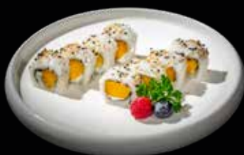
72 URAMAKI MANGO PHILADELPHIA