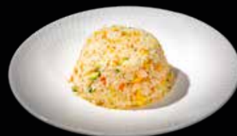
99A RISO AL SALMONE