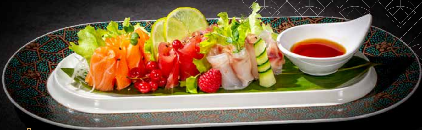
8 CARPACCIO MISTO