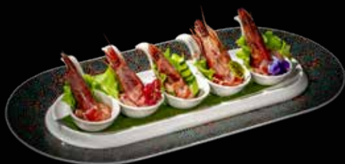
10 SASHIMI GAMBERI* ROSSI