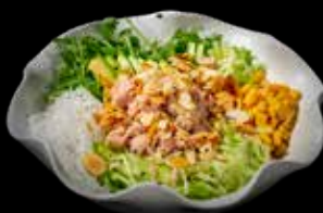
23 SALAD TONNO COTTO Tonno cotto, iceberg salad, rucola, avocado, rapa bianca cinese, cetriolo €10.00