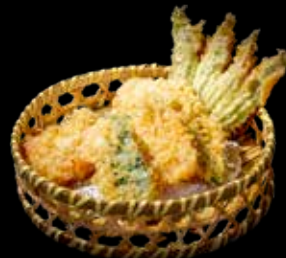
92A TEMPURA DI VERDURE