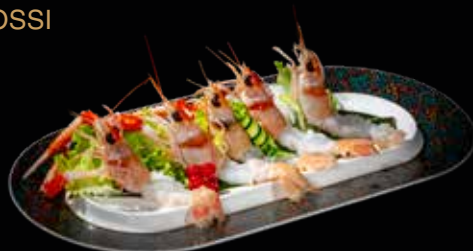
202 SCAMPI* IN EMULSIONE