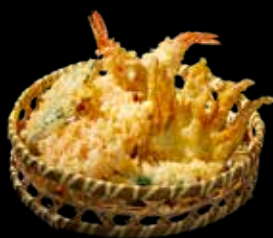
91 TEMPURA MISTA