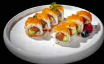
40A TOBIKO* ROLL

Maki con dentro salmone avocado ed all'esterno ricoperto di tobiko*