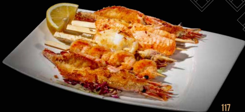
117 SPIEDINI MISTI DI MARE 6 PZ. fatti alla griglia €12.00