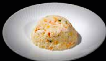
102A RISO CON GAMBERI*