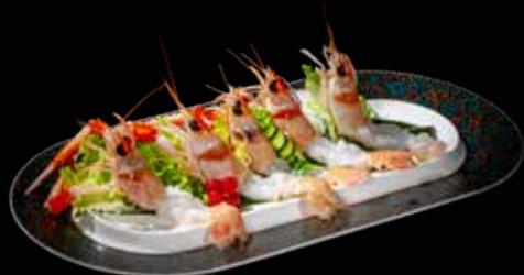
9 SASHIMI SCAMPI*