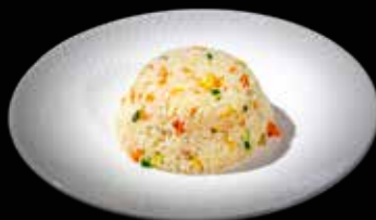
99 RISO ALLE VERDURE