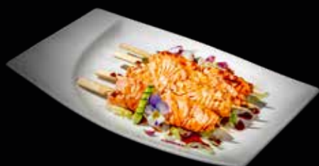
117A SPIEDINI DI SALMONE 4 PZ. Fatti alla griglia €10.00