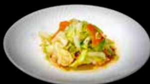
137 VERZA AGROPICCANTE €6.00