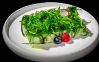
73 URAMAKI VEGETARIANO Maki con dentro avocado e cetriolo e fuori alga wakame €8.00