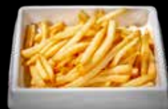
139 PATATINE FRITTE €4.00