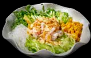
24 SALAD GAMBERI* COTTI Gamberi* cotti, iceberg salad, rucola, mango, mais, cetriolo e rapa bianca cinese €10.00