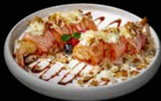
67 PHILADELPHIA ROLL (SENZA RISO)

6 pz. Gambero* fritto avvolto con salmone scottato e sopra Philadelphia, granella di tempura, cipolla frita, mandorle e teriyaki