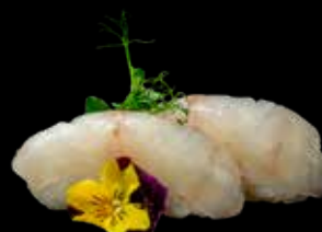
36E NIGHIRI BRANZINO