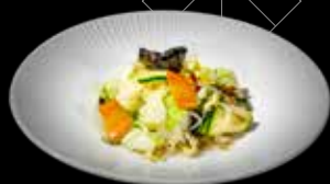
136 VERDURA MISTA COTTA €6.00