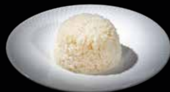
98B NISHIKI SUSHI RICE