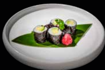
71 HOSOMAKI AVOCADO