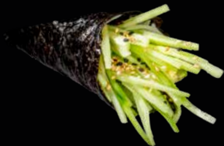
68 TEMAKI AVOCADO E CETRIOLO