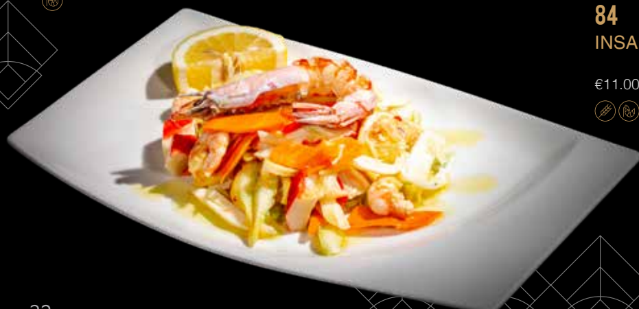
84 INSALATA MISTO MARE