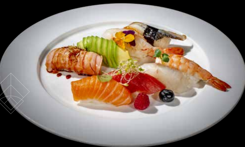
37A NIGHIRI MISTI