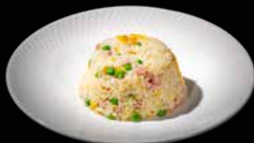
100 RISO AL CANTONESE