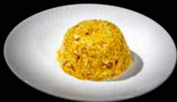
98 RISO AL CURRY