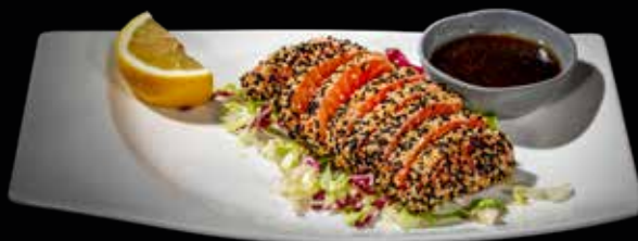
121 TATAKI SALMONE