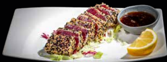
120 TATAKI TONNO