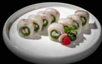
53 RUCOLA ROLL

Maki con dentro gamberi* cotti, rucola e all'esterno branzino scottato