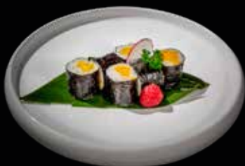
70 HOSOMAKI MANGO