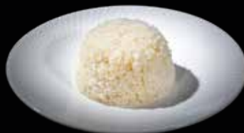
98A JASMINE THAI RICE