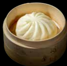
307 BAOZI 1 pz. Panino cinese con ripieno €3.00