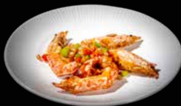
118 GAMBERONI SALE E PEPE