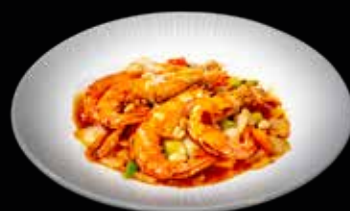
119 GAMBERONI* PICCANTI