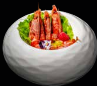
201 GAMBERI* ROSSI IN EMULSIONE