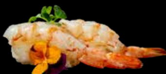
36D NIGHIRI GAMBERI* CRUDO