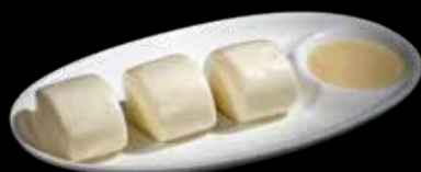
301 PANE AL VAPORE 3 pz. €5.00