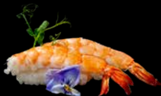
36C NIGHIRI GAMBERI* COTTI