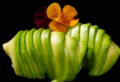
69 NIGIRI AVOCADO