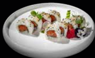
39 SALMONE PHILADELPHIA