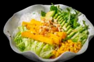
22 SALAD TROPICALE Iceberg salad, rucola, avocado, mango, mais, rapa bianca cinese, cetriolo, fette di mandorle €8.00