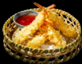
92 TEMPURA GAMBERI* 5 pz. €9.00