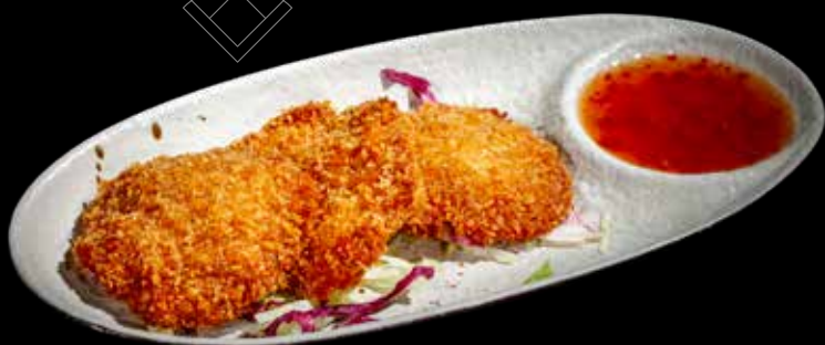
90 POLPETTE DI GAMBERI*