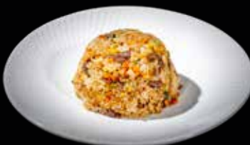
101 RISO MANZO* E VERDURA