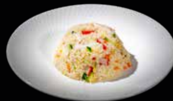
102 RISO CON FRUTTI DI MARE*