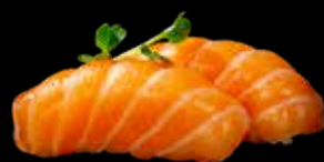
36A NIGHIRI SALMONE