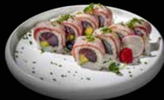
55 TONNO PROFUMATO

Maki con dentro tonno e avocado e all'esterno tonno scottato ed erba cipollina