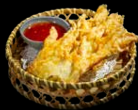
91A TEMPURA FIOR DI ZUCCA